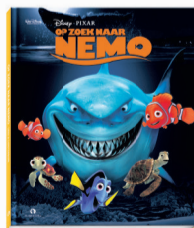
Op zoek naar Nemo