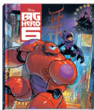
Big Hero 6