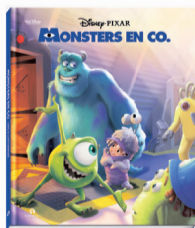
Monsters en co.