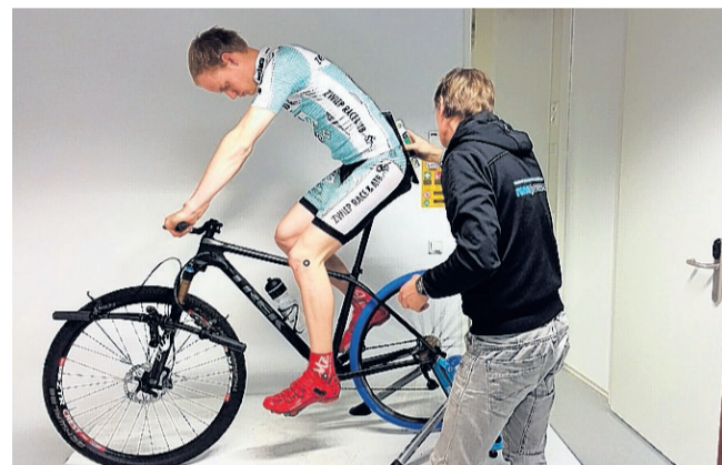
Fiets en fietser vormen altijd één geheel en moeten goed op elkaar zijn afgestemd.

Maandag 16 maart is er een voorlichtingsavond in de zaak aan de Deurningerstraat 73, waar wordt getoond hoe zo'n meting wordt gedaan. Deze avond begint om 19.00 uur. Onder de deelnemers aan deze avond wordt een bike fitting ter waarde van 150 euro verloot.